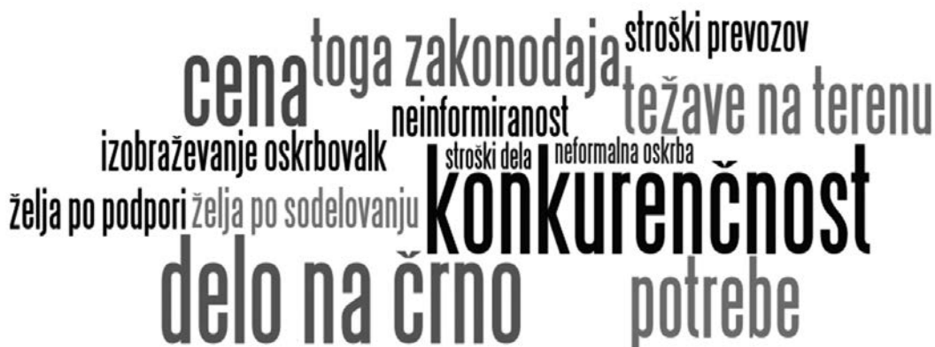
Slika 1: Izzivi, s katerimi se pri svojem delu srečujejo zasebniki, ki so vpisani v register in imajo dovoljenje za delo.

Nekateri sogovorniki opozorijo tudi na povečanje povpraševanja po socialni oskrbi v zadnjem