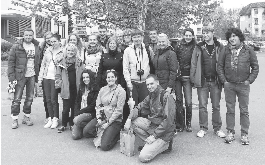
Fotografija 1: Tuji Erasmus študenti pred Fakulteto za socialno delo.

kakovostna, izvirna in zaželena. V nasprotju z državami evropskega juga, v katerih se socialno delo tesneje povezuje z medicinsko paradigmo, Fakulteta za socialno delo brez dvoma sodi na evropski sever, kjer je veliko bolj poudarjena psihološka razsežnost te znanosti, ki povečuje moč uporabnika oziroma, če uporabim lokalno izrazoslovje, zaveznika in sopotnika v soustvarjenem procesu pomoči.